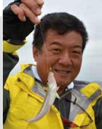
▲ベテランのT氏は軽く東越え