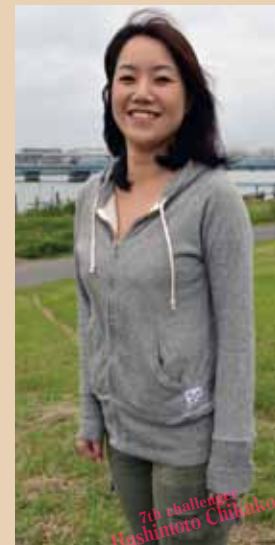
釣りの経験は川や堤防釣り程度。船釣りはまったくの初心者ですが釣れるんじゃないかと思って応募しましたが、私の考え甘いかしら？

「アタったよ、巻いて巻いて」と言われ、首をかき上げながらリールを巻いてくる彼女。海面に現れたのは15センチのかわいいシロギスだった。初めて見る魚体をしげしげと眺めながら感無量の様子。 次の投入では18センチ、3投目には20センチと徐々にサイズも大きくなっていく。手返しはまだまだ遅いが、ようやくシロギス釣りに慣れてきたようだ。 10時前から雨が降り出す。釣れるペースは尻上がり。風も強くなって海況は悪化する一方だが、釣れているだけにだれも手を休めない。20センチ前後の良型ばかり釣れる時間帯もあって、船上は熱気ムンムン。 風が強くなってきた午後2時前にやや早い納竿合図。13〜24センチをトップ11尾、彼女も34尾を釣り上げた。 「雨も気になりませんでした」と話す彼女。いずれ彼女の趣味に「釣り」が加わるのは間違いなさそう。