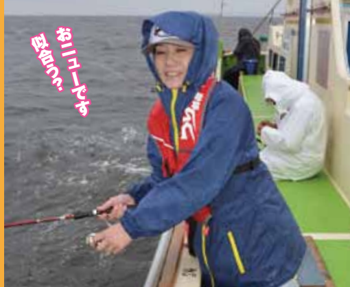
▲雨でもきちんとしたウエアを着ていれば快適です