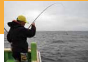
▲もう一人の同船者も東釣り達成