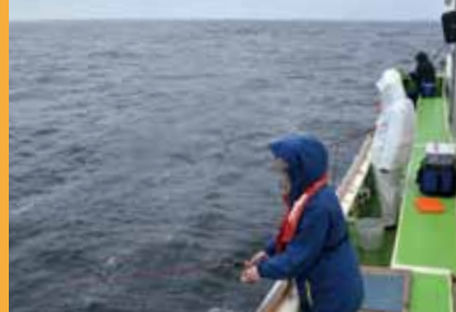
▲釣り場は富津沖の12メートルダチ