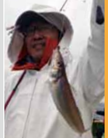
▲後半は良型が目だった