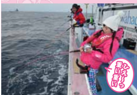
▲147センチの小柄な体格にはかなりハードだったか