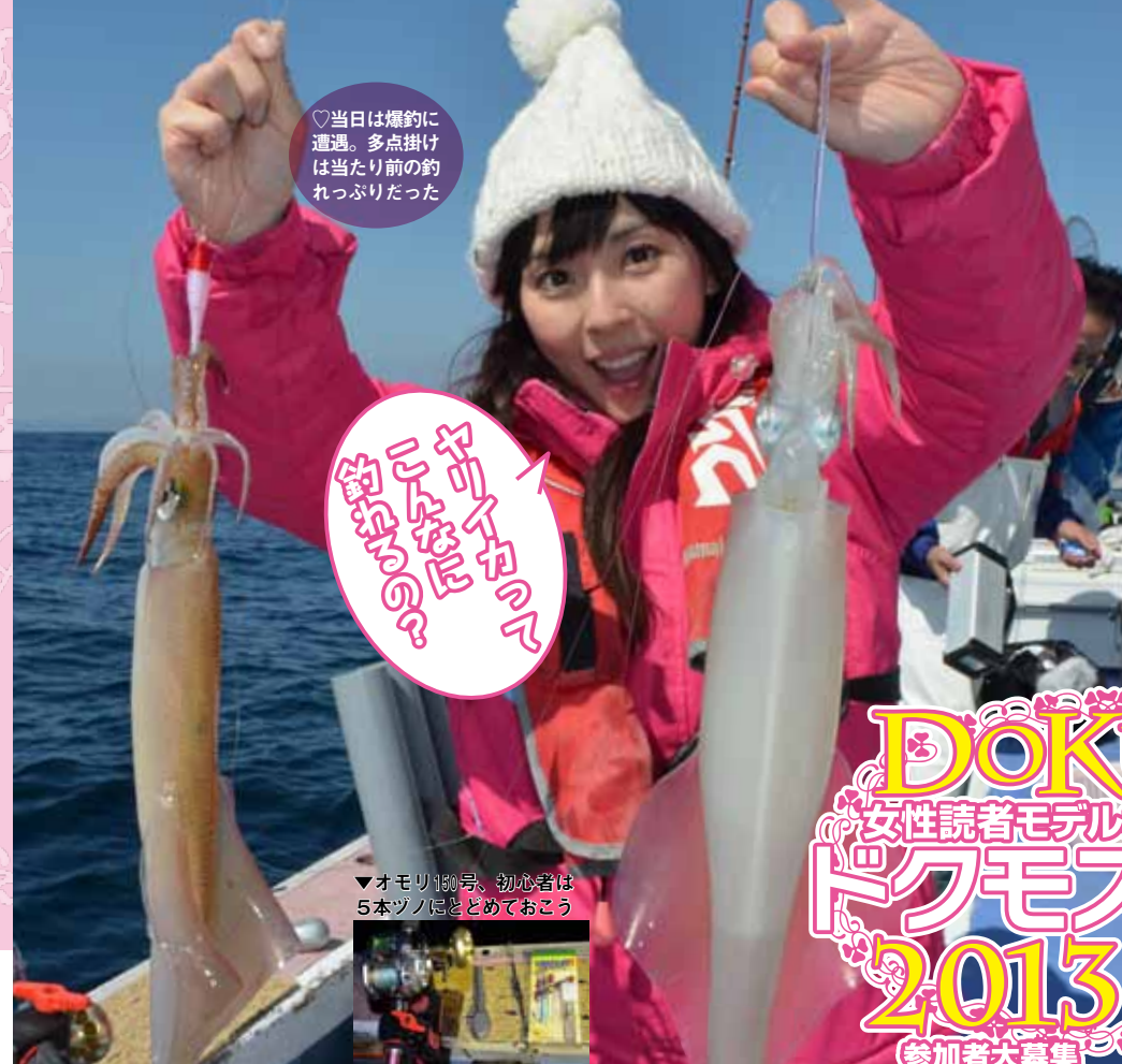
▲8時にはソバ抜き達成