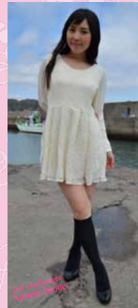
●小さいころから父と釣りに行ってました。今はルアーがメインですが、これから色々な釣りにチャレンジしてみたいと思って応募しました。