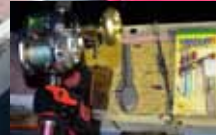
▼オモリ180号、初心者は5本ツノにとどめておこう