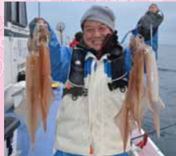
▲5杯掛けは当たり前、最高10杯掛けもあった