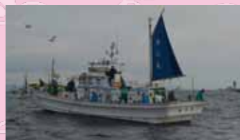
▲当日は別船のトップも束釣りだった